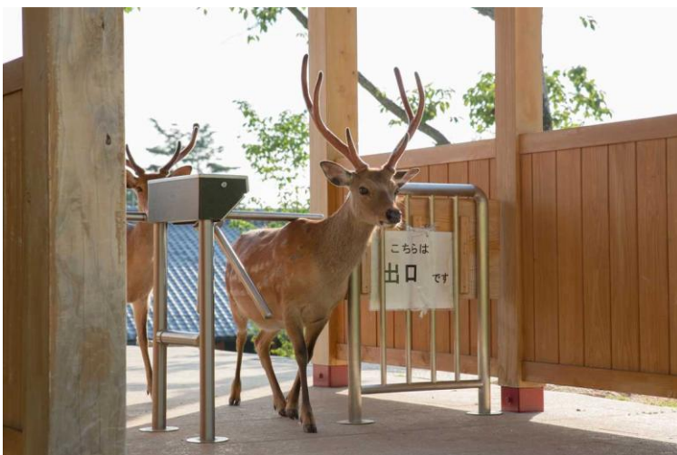
6 Aus der Serie "Dear Deer" Auf dem Schild am Gitter steht "Hier ist der Ausgang"