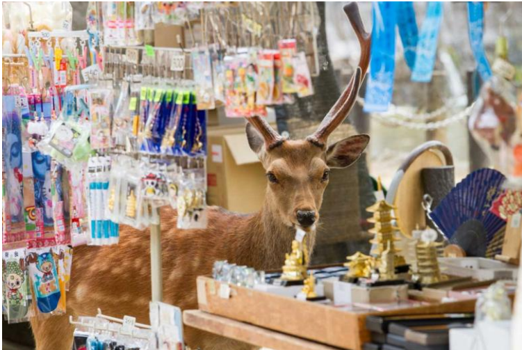
4 Aus der Serie "Dear Deer"