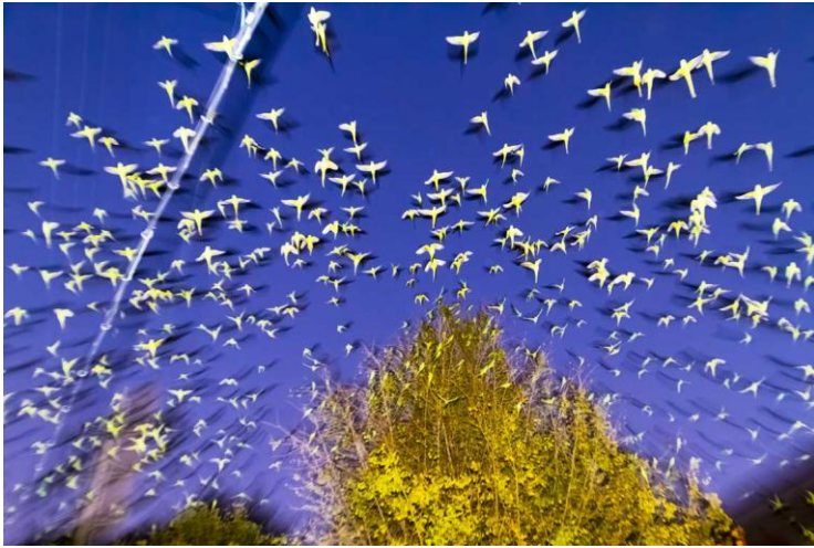
7 Aus der Serie "Tokyo Parrots"