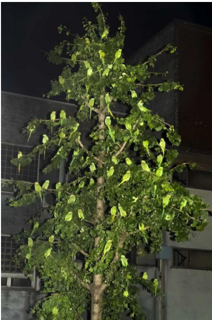
8 Aus der Serie "Tokyo Parrots"