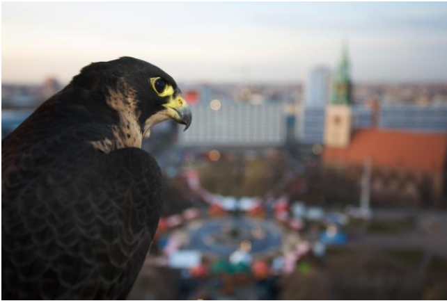
10 Wanderfalke in Berlin-Mitte