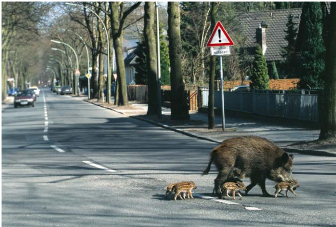
11 Bache mit Frischlingen in Berlin