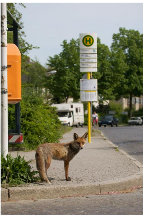
12 Fuchs in Berlin