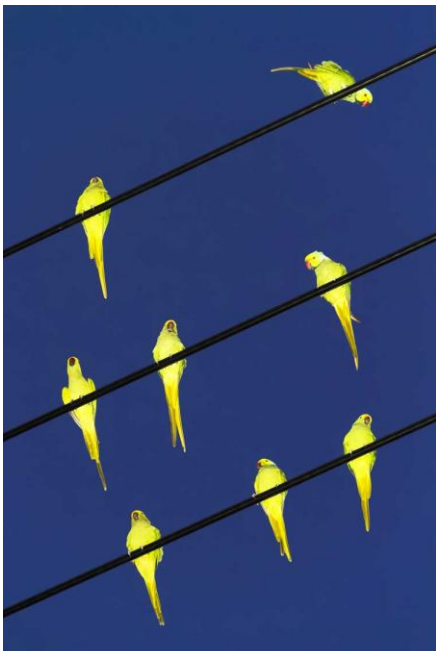
9 Aus der Serie "Tokyo Parrots"