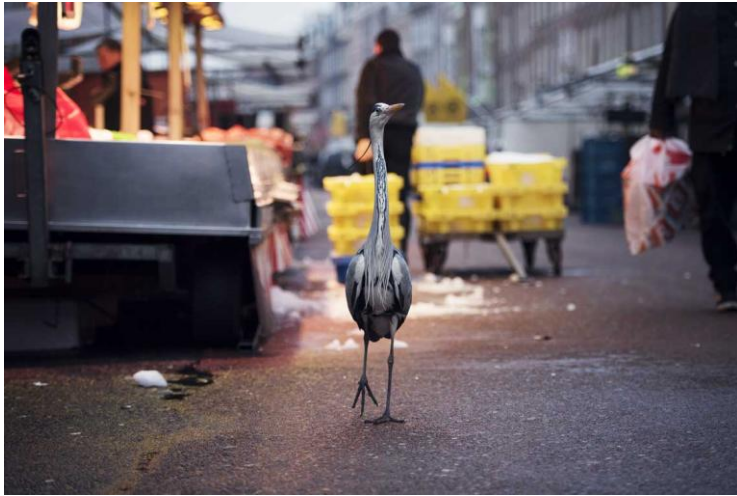
1 Aus der Serie "Dam Herons"