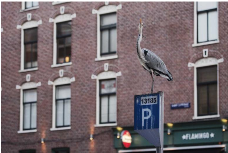
2 Aus der Serie "Dam Herons"