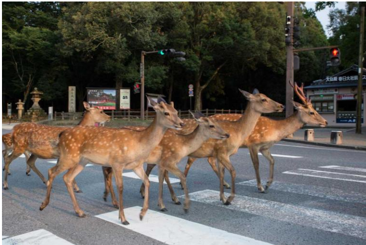
5 Aus der Serie "Dear Deer"