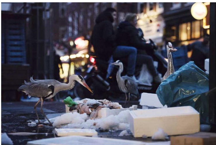
3 Aus der Serie "Dam Herons"