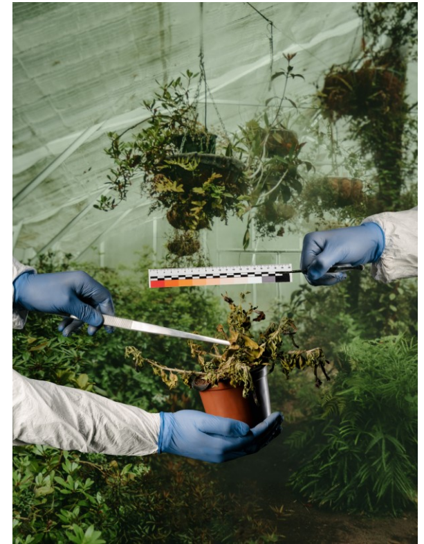
Das Petunien-Gemetzel 011