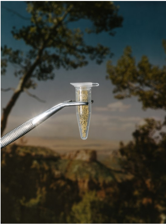
Das Petunien-Gemetzel 049