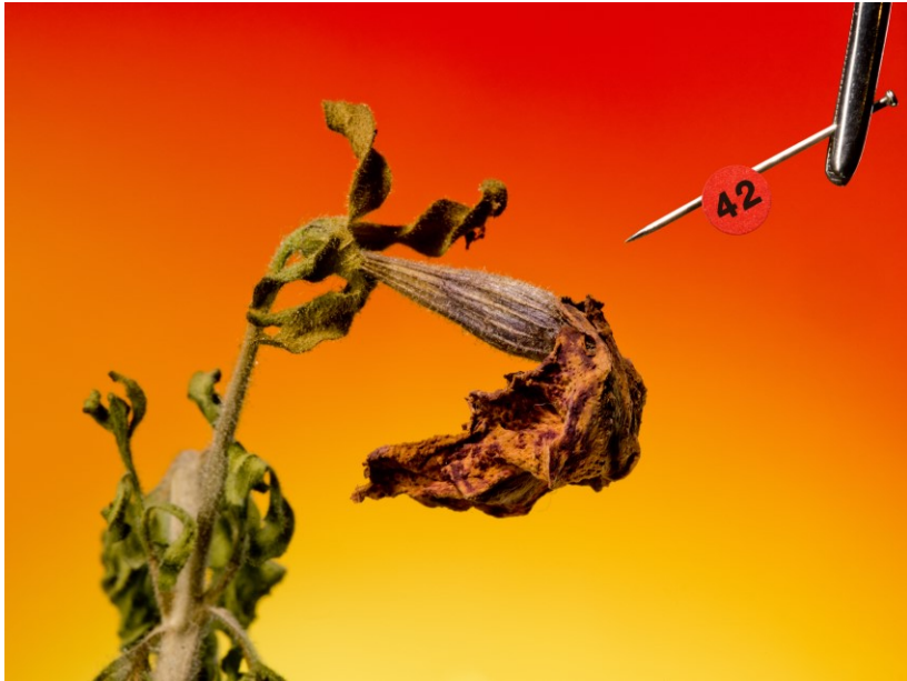
Das Petunien-Gemetzel 023