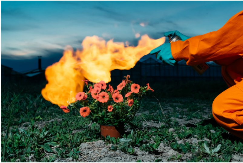
Das Petunien-Gemetzel 069