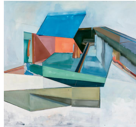
teile_12, 2019 Öl auf Leinwand © Birte Horn