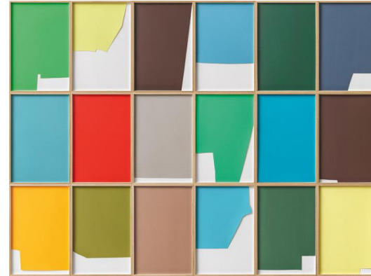
papercut_18, 2019 Letraset © Birte Horn

bitte bestellen beim Presserundgang oder per E-Mail an c.ammann@ulm.de