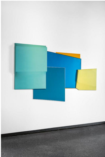
Installation, standout 3 und 4, Farbfonds, 2021 © Birte Horn