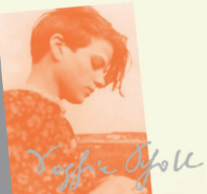
Plakat der aktuellen Wanderausstellung der Weiße Rose Stiftung