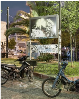
Eva Leitolf , aus der Serie: Postcards from Europe, Attiki-Platz, Athen, Griechenland, Archivpigmentdruck, Archivkarton, 2011, VG Bild-Kunst Bonn, 2024

Murcia, ein Ort in Südspanien im Tal des Río Segura. In dieser fruchtbaren Ebene leben Erntehelfer, Flüchtlinge, Aussteiger und Rentner gemeinsam auf der Suche nach einem besseren Leben. Anhand von Portraits und Landschaften erzählt Göran Gnaudschun deren Geschichten und zeigt so Murcia als einen Mikrokosmos, in dem sich die vielen Widersprüche und Ungleichheiten der modernen, globalisierten Welt auf eine menschliche Weise verdichten.