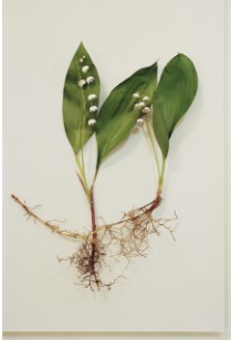
Ulrike Kolb , o. T. (Museum), Archival Print, 2016

Geschichten des Krieges sind ein fester Bestandteil der Fotografie. In „American Interiors“ blickt M L Casteel auf Veteranen, die von der Front aus Afghanistan und dem Irak zurückgekehrt sind und alleingelassen mit ihren Traumata isoliert am Rande der amerikanischen Gesellschaft leben. Casteel fotografierte das Innere ihrer Autos – oft ihr letzter Zufluchtsort und Rückzugsraum auf der Suche nach Halt und Geborgenheit und ein Spiegelbild ihrer inneren Zerrüttung, aber auch ihrer Sehnsüchte und Träume.