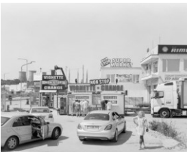
Ute Mahler & Werner Mahler , aus der Serie: An den Strömen, Donau #127, Silbergelatineabzug auf Barytpapier, 2019

Der Klimawandel schafft neue Nischen und Lebensräume. In „Staygration“ zeigt Andy Heller Situationen der Transformation und Anpassung. Einst ein Zugvogel, hat der Storch aufgrund der Klimaerwärmung die Wintermigration nach Afrika aufgegeben und residiert nun in Portugal inmitten von Ballungsgebieten, wo er die vom Menschen geschaffenen Strukturen für sich nutzt. Hellers Fotografien und Videoloops zeigen Landschaftsbilder dieser neuen Co-Existenz und thematisieren das komplexe Verhältnis von Mensch und Natur.