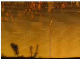
Oliver Krebs , aus der Serie: Signal & Rauschen, ohne Titel, C-Print, 2018, VG Bild-Kunst Bonn 2024

Museen und Archive schaffen über ihre Sammlungen Geschichtserzählungen und Realitätsinterpretationen, denen in Gesellschaften identitätsstiftende Wirkung zukommt. Was gilt es zu bewahren und was müssen wir vergessen? Mit ihren dort entstandenen Fotografien geht Ulrike Kolb genau dieser Frage nach, die elementar wird, wenn es um die Weitergabe von Wissen und Gewissheiten geht.