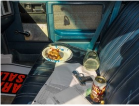
M L Casteel , aus der Serie: American Interiors, Untitled (Gun & Hamburger), Archival Pigment Print, 2014

Geschichten des Krieges sind ein fester Bestandteil der Fotografie. In „American Interiors“ blickt M L Casteel auf Veteranen, die von der Front aus Afghanistan und dem Irak zurückgekehrt sind und alleingelassen mit ihren Traumata isoliert am Rande der amerikanischen Gesellschaft leben. Casteel fotografierte das Innere ihrer Autos – oft ihr letzter Zufluchtsort und Rückzugsraum auf der Suche nach Halt und Geborgenheit und ein Spiegelbild ihrer inneren Zerrüttung, aber auch ihrer Sehnsüchte und Träume.