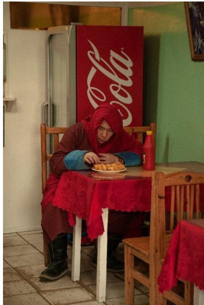
8 Taij Taichar Ein buddhistischer Mönch im Kloster Gandan.