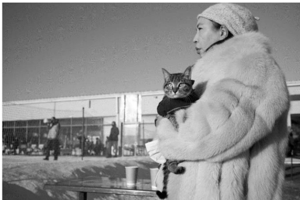
3 Injinaash Bor Katze klammert sich an einen teuren Pelzmantel, Ulaanbaatar 2021