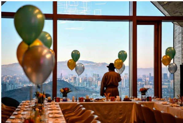
2 Injinaash Bor Ein Mann wartet in einem Luxusrestaurant in einem gehobenen Viertel der Stadt auf eine Feier. Ulaanbaatar 2019