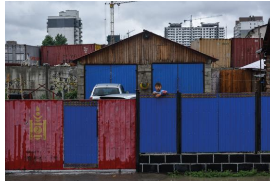
10 Erkhbayar Tsengel Nach dem Regen.