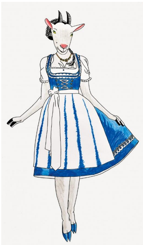
5 Die Geißenfrau Rudi Bodmeier, Farbstift/Fineliner auf Papier, 2012