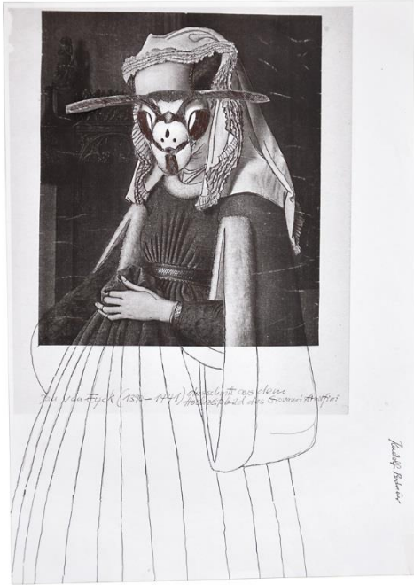
6 Ohne Titel (Ausschnitt aus dem Hochzeitsbild des Giovanni Arnolfini) Rudi Bodmeier, Collage, 2010