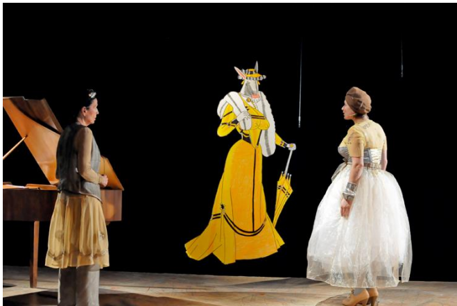
7 Szene aus „Schwanenflug“, Tams-Theater, München 2013 Figurine von Rudi Bodmeier, Farbstift/Fineliner auf Kapa- Leichtschaumplatte, 2012