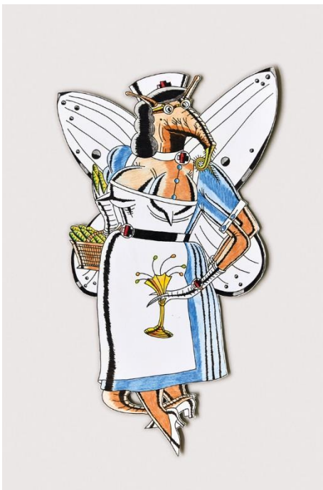
3 Schwester Annemarie Schmetterling Rudi Bodmeier, Farbstift/Fineliner auf Karton, 2010