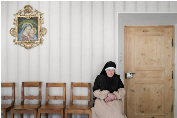
4 En attendant l'Eternité © Laurence von der Weid