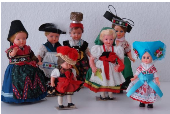
8 Trachtenpuppen