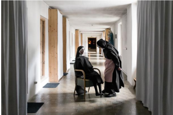
3 En attendant l'Eternité © Laurence von der Weid