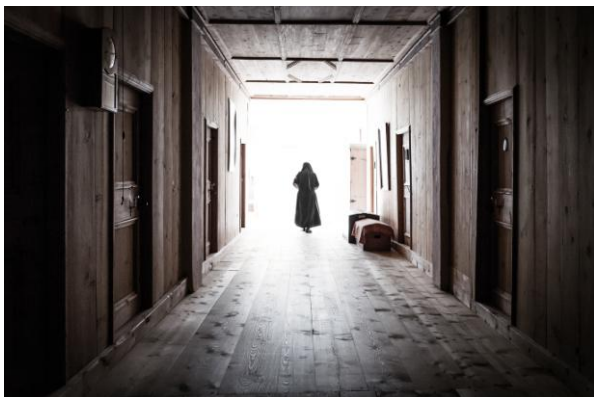
5 En attendant l'Eternité © Laurence von der Weid