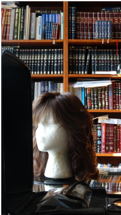
6 Aus meiner Sicht: Perücke