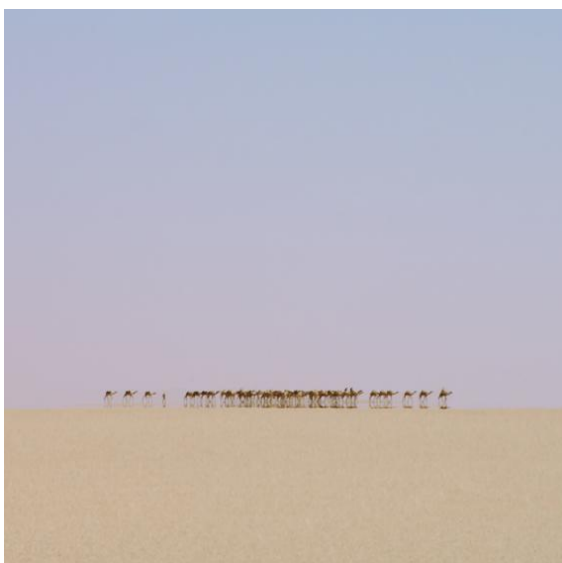
4 FREIHEIT STATT SICHERHEIT FREEDOM IN STEAD OF SECURITY Tschad Chad - Erg Djourab 2011