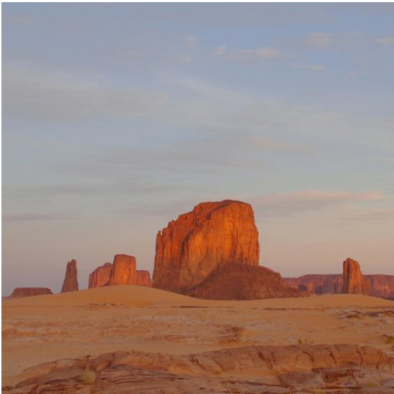
6 MONUMENTE MONUMENTS Tschad Chad - Anoua 2018