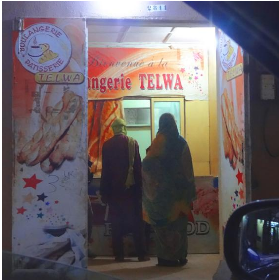
2 LA BAGUETTE Niger - Agadez 2020