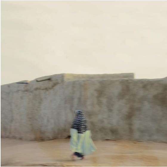
5 BEIM RUF DES MUEZZIN AS THE MUZZINE CALLS Niger - Agadez 2019