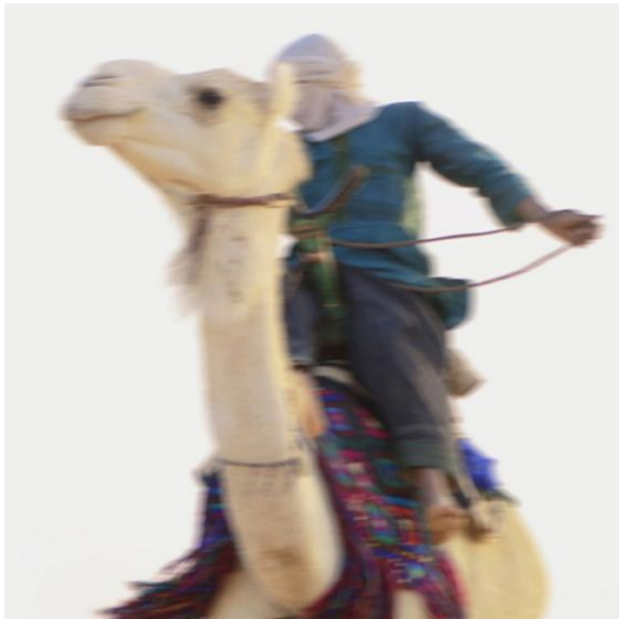
3 EIN PERFEKTES PAAR A PERFECT COUPLE Niger - Aïr 2013